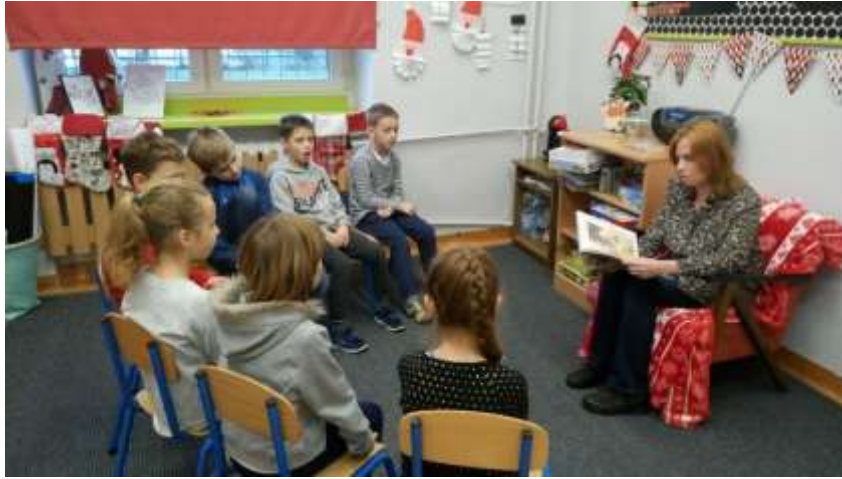
MAMA ULI Z KL. 2A