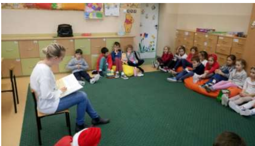
SIOSTRA KASI Z KL.. 3A