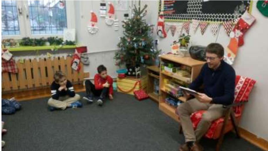
TATA KORNELII Z KL.2A