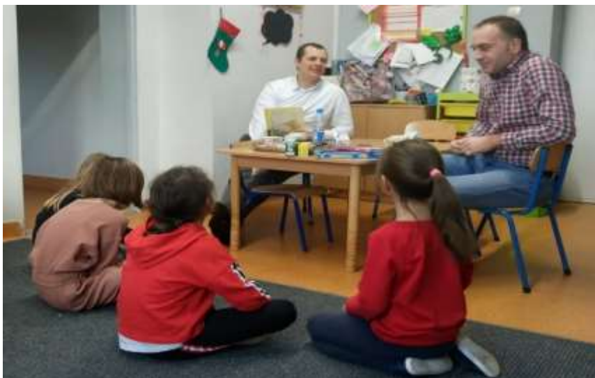
TATA AMELKI I TATA OLGII Z KL.3B