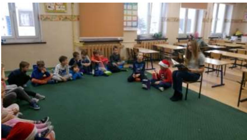
MAMA ANTONINY Z KL. 3A