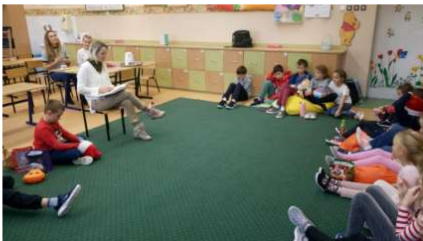
MAMA INDII Z KL. 3A