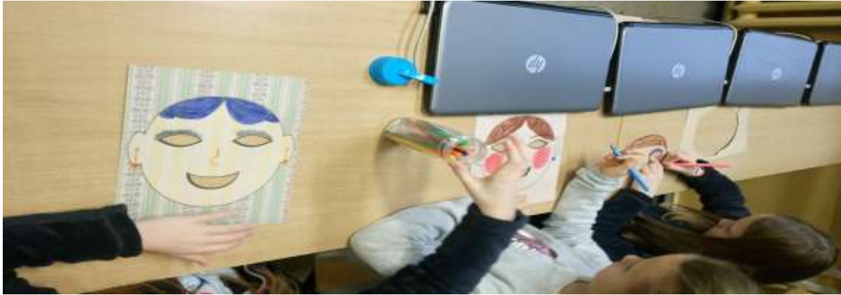
Gra językowa – „WHO AM I?”