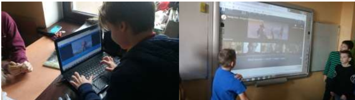
Uzupełnianie w tekście piosenki brakujących słów ( listening and writing skills)