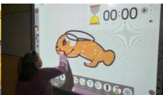
Zagadki rysunkowe o zwierzętach .