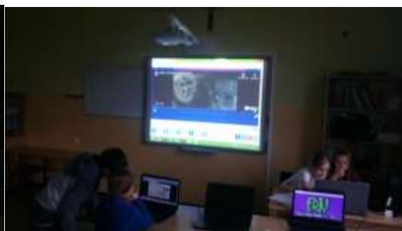
Utrwalenie nazw postaci bajkowych oraz uzupełnianie słów piosenki na podstawie słuchanego tekstu.