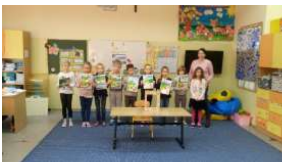
Kl. 2A gościnnie u kolegów z klasy „0”.