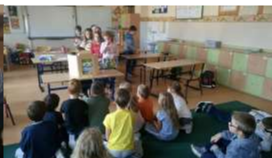
Klasa 3A przedstawia swoim kolegom na świetlicy teatrzyk Kamishibai.